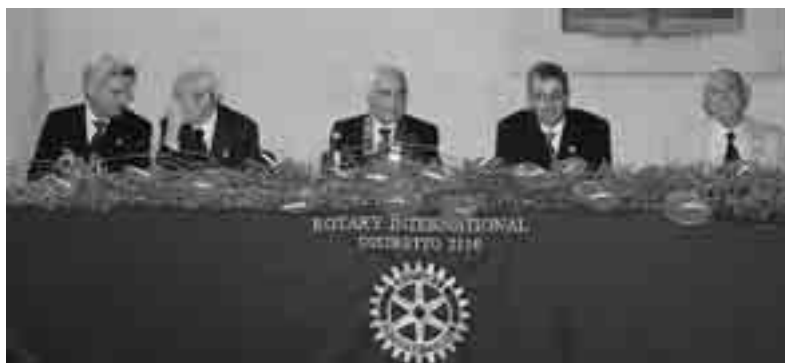
LA RIUNIONE DEL PASSAGGIO DELLA CAMPANA AL CASTELLO DI DONNAFUGATA

In questo senso sono state già composte le varie commissioni: commissione