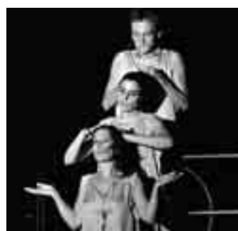
La rappresentazione delle tre sorelle Sommatino

Uno spettacolo coraggioso. Che instaura un dialogo audace tra tradizione e contemporaneità, tra letteratura e reale. La scena aperta sotto gli eucalyptus del Parco Archeologico di Kaucana concentra le luci sul dramma a tre voci di tre sorelle, declinato in canti, nostalgia, lamenti, intervallati da inni sacri e formulari religiosi. Pochi gli elementi accessori della scenografia, scarnificata al massimo, per rendere conto della vita disadorna di donne che non hanno saputo recidere i lacci oppressivi di un ordinamento sociale che è inesorabile carcere. Donne che non hanno sovvertito un sistema che, radicato in un passato che plasma la vita delle nuove generazioni su costrutti assurdi, impedisce la realizzazione libera dello spirito.