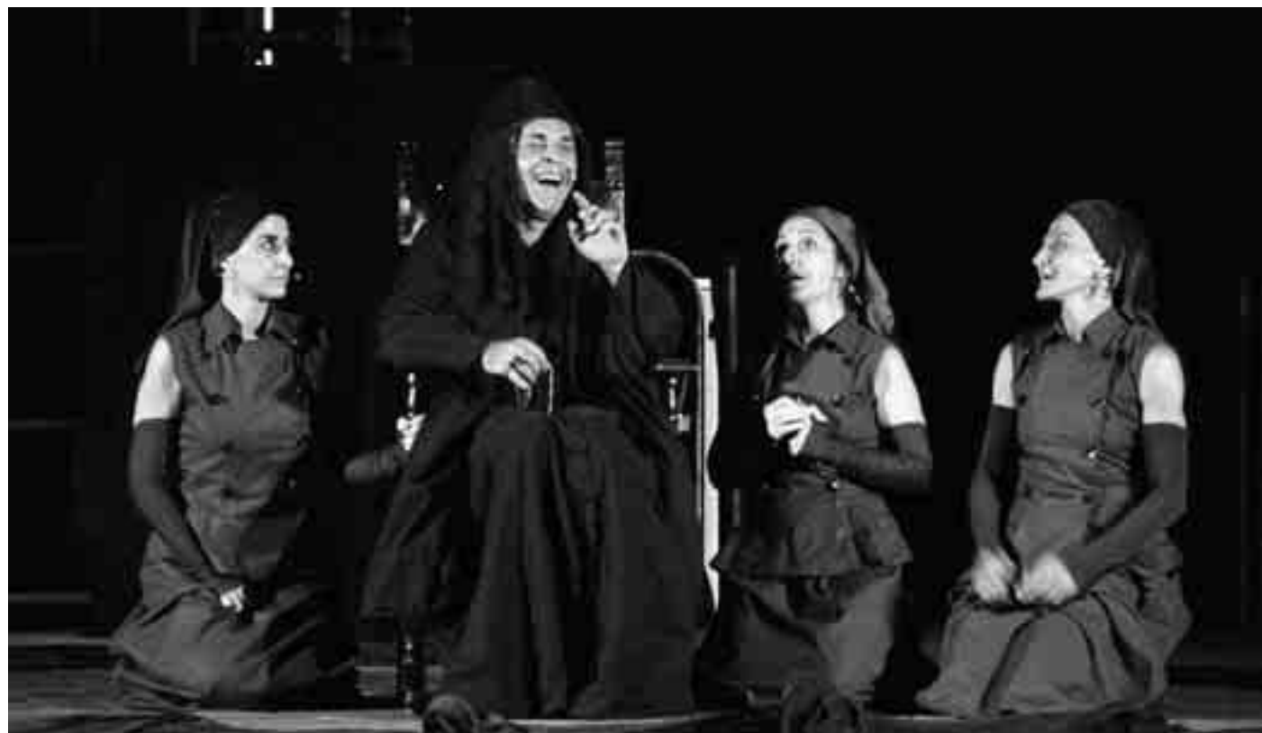
UNO DEI MOMENTI PIÙ INTENSI DELLA RAPPRESENTAZIONE ANDATA IN SCENA AL PARCO ARCHEOLOGICO DI KAUCANA

Il giovane cantautore ragusano si è imposto nella sezione «Nuove proposte» dello stesso concorso che ha incoronato Dalla e Baglioni